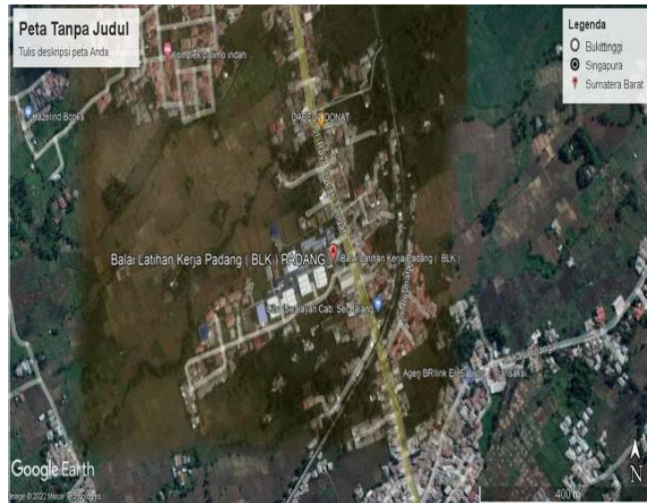
Gambar 3.3 Lokasi Proyek