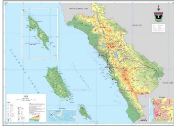
Gambar 1 Peta Lokasi Penelitian