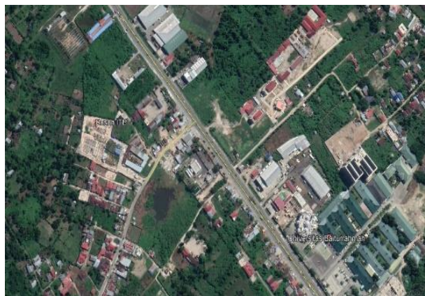
Gambar 2 Lokasi Penelitian