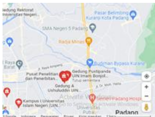
Gambar 2 Lokasi Gedung Kampus UIN Kota Padang Sumatera barat